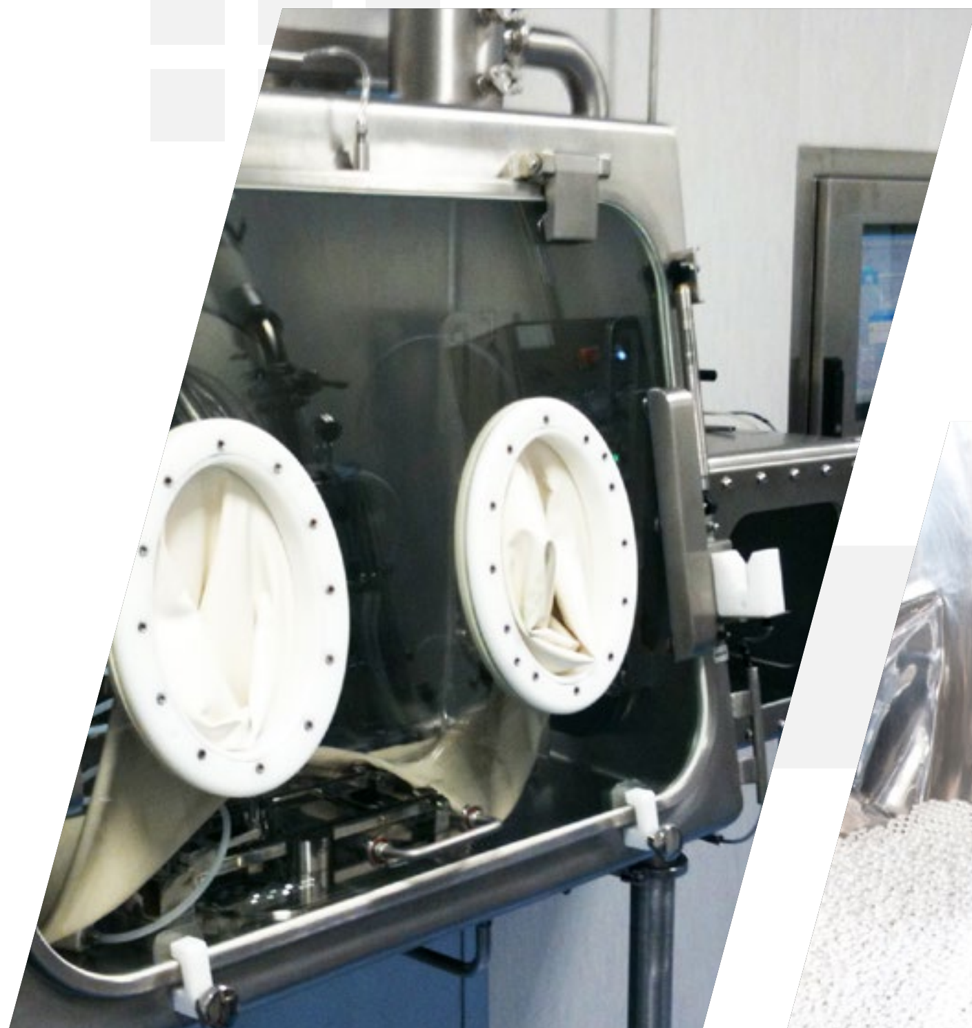
L'isolatore si integra perfettamente con il sistema NCS

Il sistema NCS lavora ogni tipo di compressa